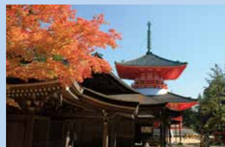
高野山 根本大塔(高野町)