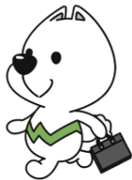
和歌山県PRキャラクター「がいちゃん」