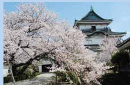
和歌山城(和歌山市)