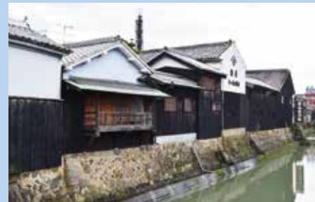
重要伝統的建造物群保存地区(湯浅町)