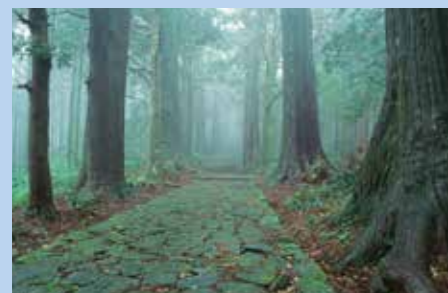
那智山大門坂(那智勝浦町)